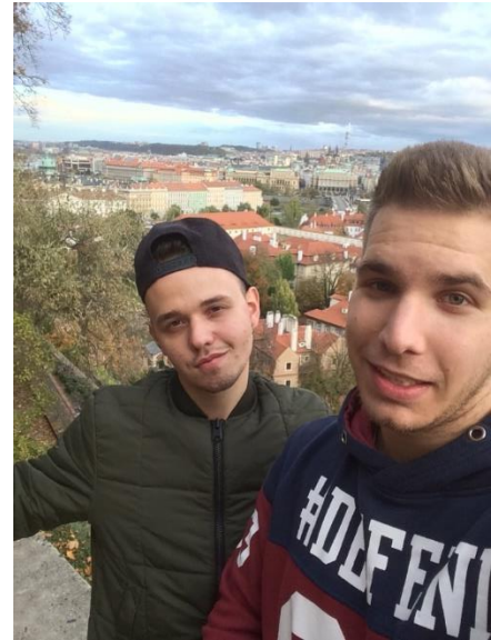
1. ábra Kilátás Prága tetejéről, a várból

Prága még talán a közelebb eső Erasmusos egyetemek közé sorolható, mindössze egy 6,5 órás vonat/buszút választja el Budapeستől. Mindkét közlekedési formát tudom ajánlani, hiszen nem vall rájuk, hogy késsenek. A buszok kényelmesek és modernek, frissítő étel, ital és ülésbe épített kis TV is az