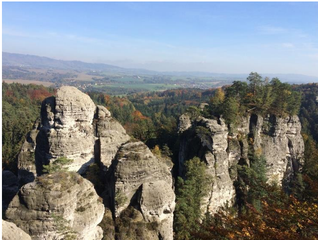
2. ábra Bohemian Paradise (Prágtól 1 órára lévő csodálatos nemzeti park)

Magától a vasútállomástól, illetve a buszpályaudvartól a kollégium - ahol laktam - 30 percre volt tömegközlekedéssel, ami Prágában egy közepes utazási időnek számít városon belül. Az egyetemnek egyébként 3 kollégiuma is van és minden külföldi részképzésre induló hallgató választhat, hogy melyikben szeretne fél évet eltölteni, és ezt a választást figyelembe veszik. Igyekeznek úgy intézni mindent, hogy mindenki oda kerüljön, ahova szeretett volna. Megérkezéskor az első dolog természetesen a szállás elfoglalása, kipakolás, berendezkedés volt. Ez azért volt egy kissé nehézkes, mivel a kollégium portáján dolgozó személyzet sajnos nem beszél az angolt, így a kommunikáció már az elején halálra volt ítélve. Mindemellett nagyon segítőkészek voltak, és különösebb problémák nélkül foglaltuk el a szobánkat. Ezután több fontos dolgot is el kellett intéznünk, mint például a közlekedési jegyek/bérletek megvásárlása vagy a WIFI beüzemelése. Mindkettőhöz el kellett mennem az egyetemre, ahol talán összesen 5 percet - ha töltöttem - és minden kész is volt.